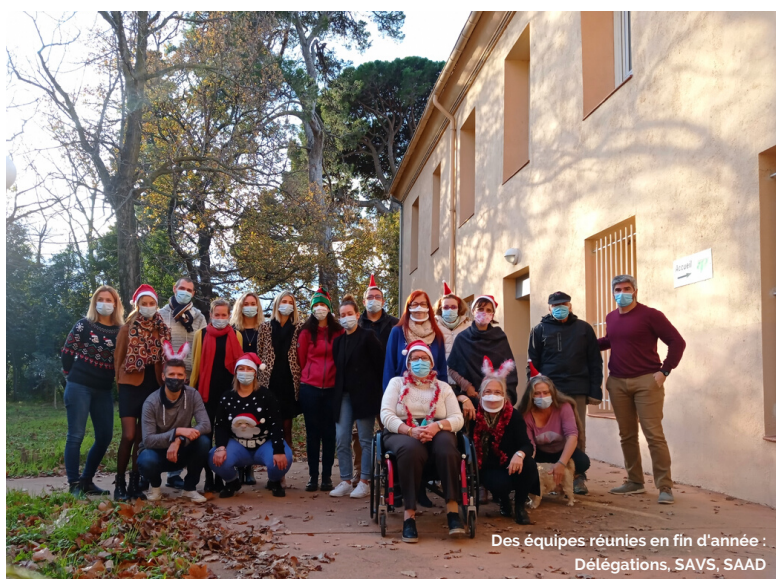
Des équipes réunies en fin d'année : Délégations, SAVS, SAAD

"Une page se tourne, une nouvelle s'ouvre"